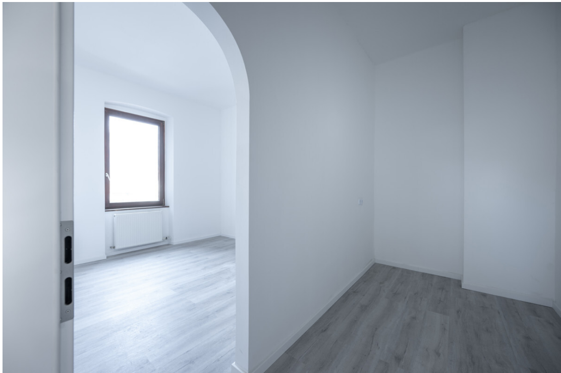
Schlafzimmer mit begehbarem Kleiderschrank